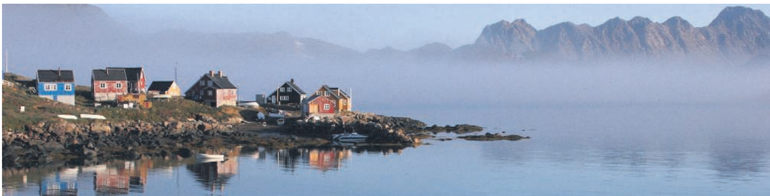
Kulusuk med sine 300 indbyggere er lidt mindre isoleret end de øvrige fire bygder i Ammassalik-distriktet, fordi østkystens eneste internationale lufthavn ligger et par kilometer derfra. Det betyder for eksempel, at der hver dag i sommersæsonen kommer et fly fra Island med turister fra hele verden.

Ny nordisk skole. En lille bygdeskole på Grønlands østkyst viser flotte faglige resultater. Det på trods af at en tredjedel af eleverne har såkaldt 'særlige behov', og at byen ligger meget isoleret.